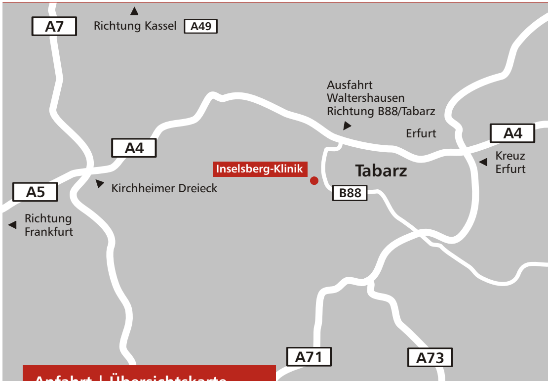
Anfahrt | Übersichtskarte

Telefon 036259 53-0 Fax 036259 53-213 E-Mail info@inselsberg-klinik.de Internet www.inselsberg-klinik.de